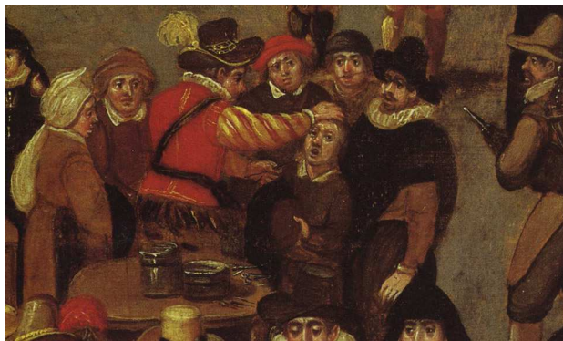
Anonyme (Fin XVI e siècle). École Flamande. Musée Royaux des Beaux-Arts de Belgique. Bruxelles. Détail.