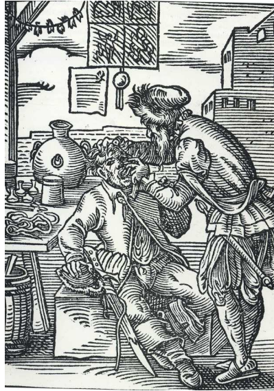
Jobst Amman (1539-1591). École Allemande. Gravure tirée du « Livre des métiers » de Hans Sachs, Nuremberg 1568.

L'iconographie du XVIII e siècle et antérieure ne nous permet pas de trancher, quelques représentations de scènes dentaires nous montrant des gauchers.